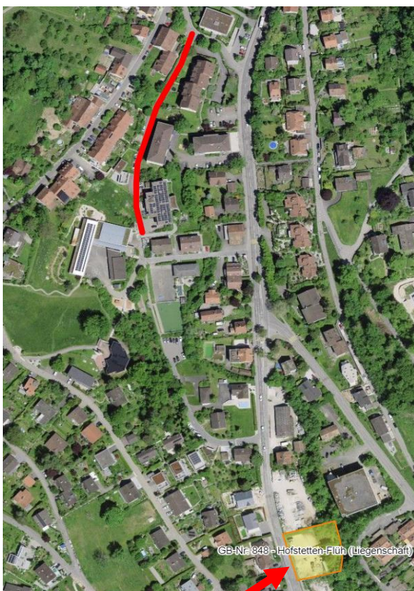
Abbildung 1: Ausweichparkplätze Parzelle 848